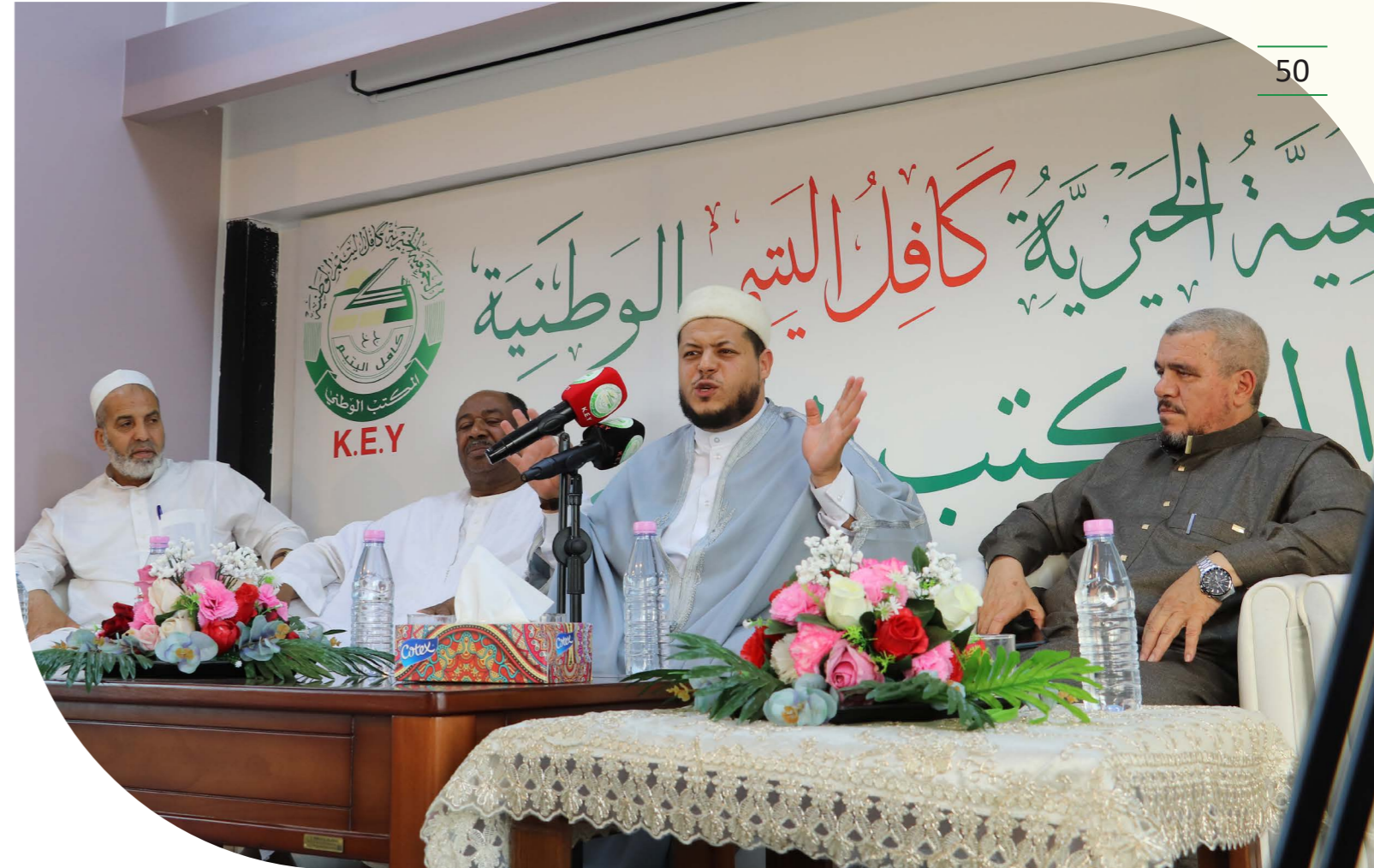
الجمعية الخيرية كافل اليتيم الوطنية