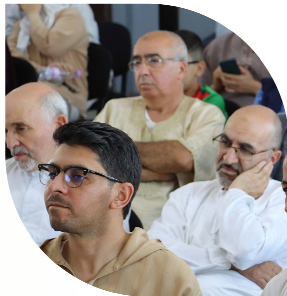
الحصيلة السنوية 2 0 2 4